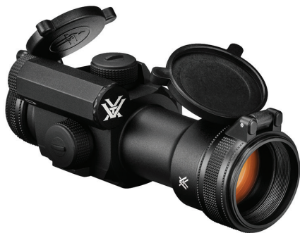
Option anneau de montage bas (hauteur 21 mm)